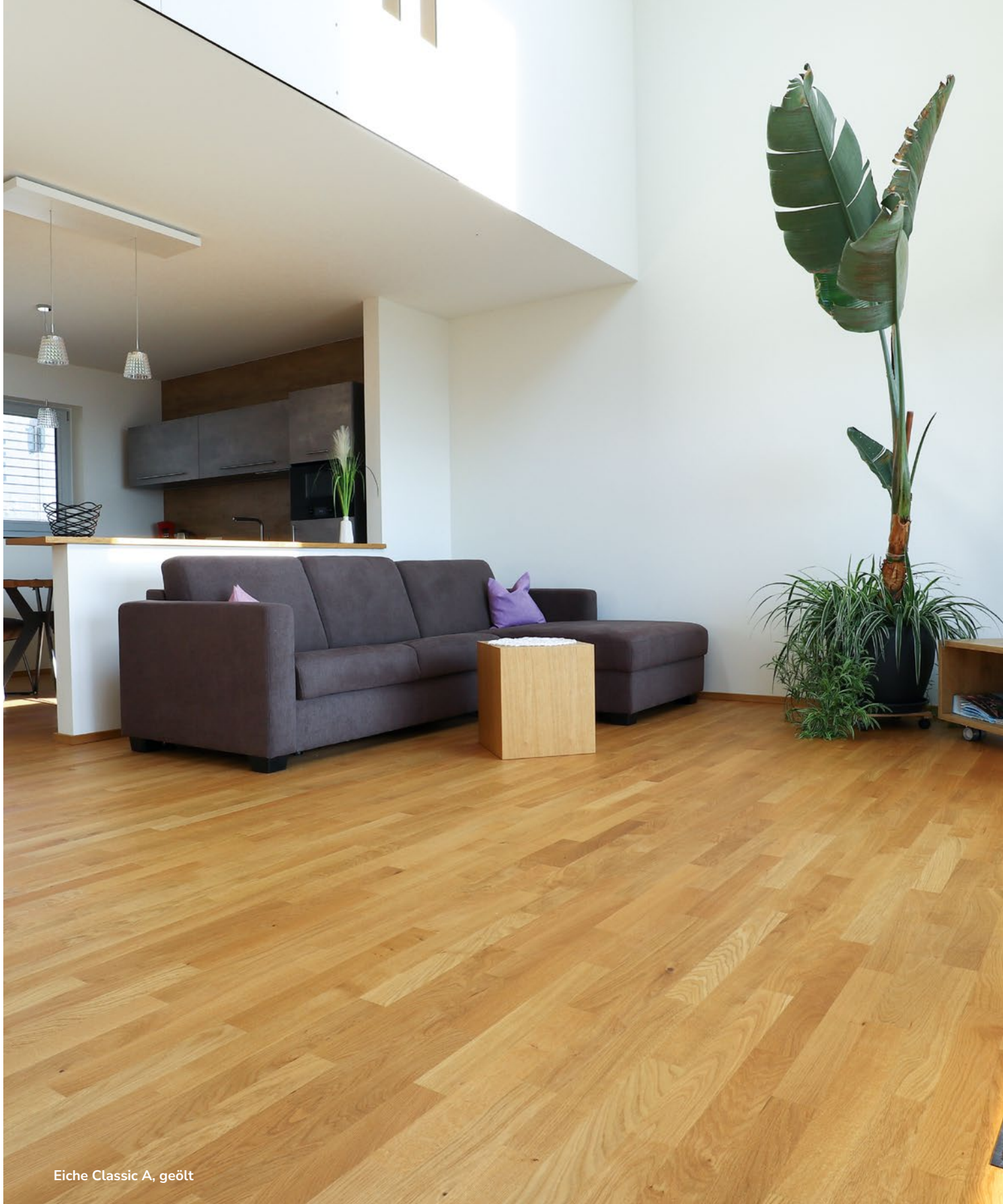
Eiche Classic A, geölt