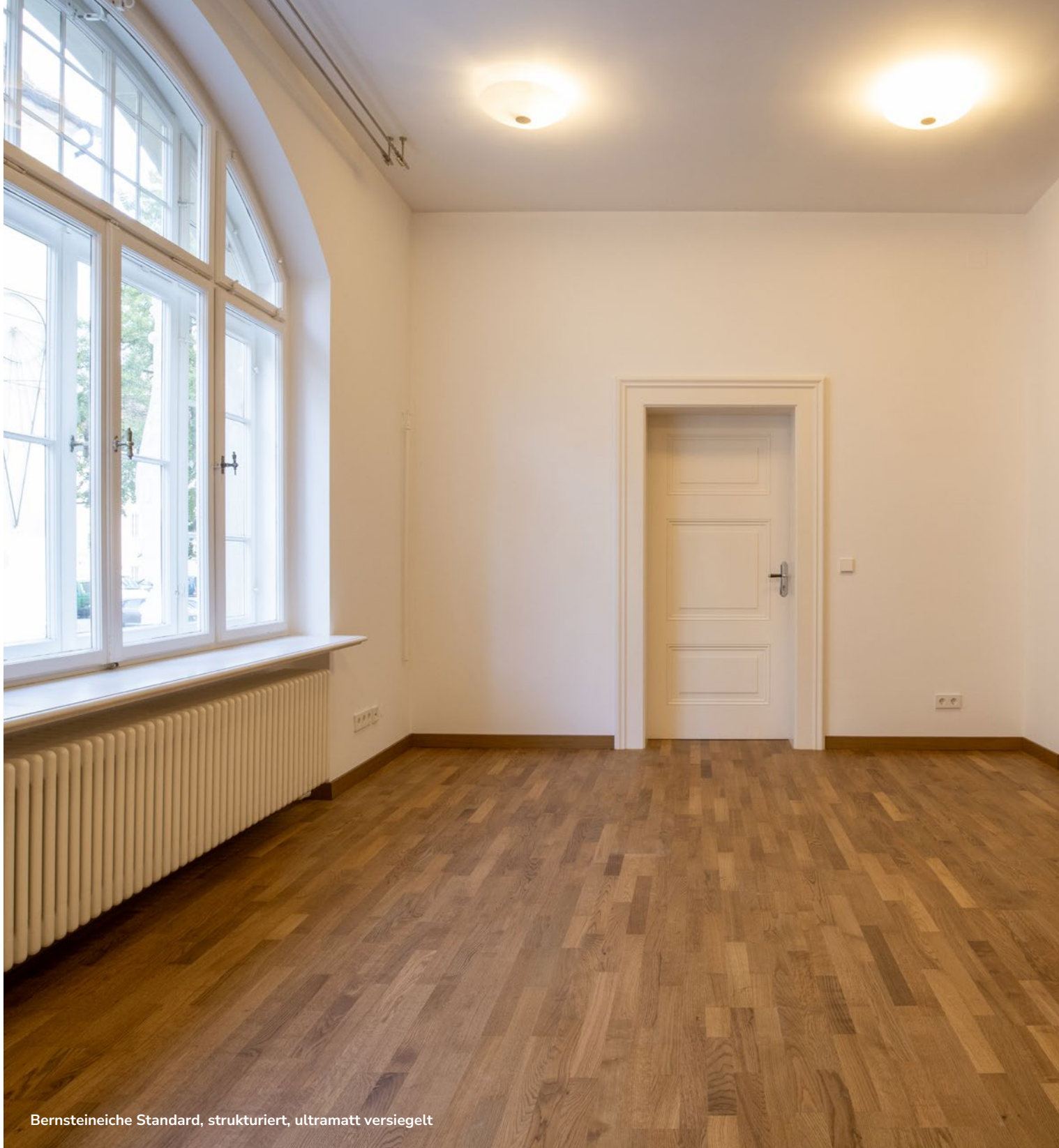
Bernsteineiche Standard, strukturiert, ultramatt versiegelt